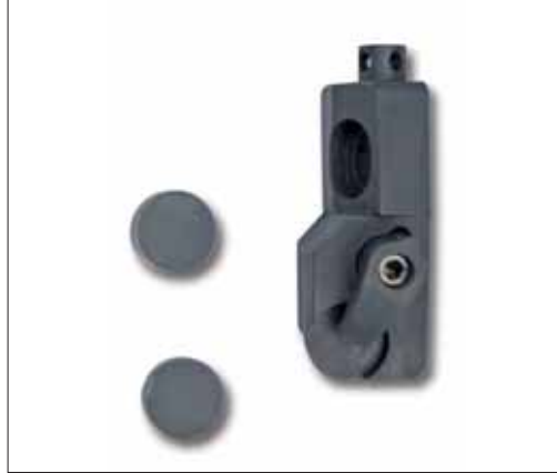
Cartuccia porta inserto \varnothing 12,7 (corredo supplementare) - Inserto CBN \varnothing 12,7 (corredo supplementare) - Inserto PCD \varnothing 12,7 (corredo supplementare) Insert holder cartridge, \varnothing 12.7 (extra outfit) - CBN insert, \varnothing 12.7 (extra outfit) - PCD insert, \varnothing 12.7 (extra outfit)