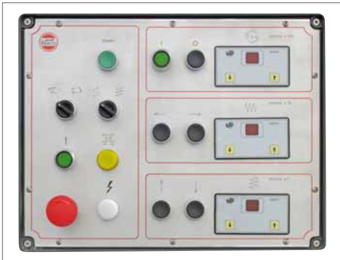
Pannello comandi versione manuale Control panel, manual version