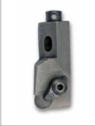
Cartuccia completa di inserto CBN \varnothing 9,52 (corredo supplementare) Cartridge complete with CBN insert, \varnothing 9.52 (extra outfit)