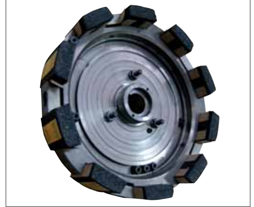
Disco porta segmenti abrasivi diametro 360 mm. Segmental wheel holder plate 360 mm dia.