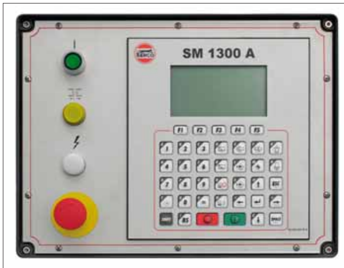
Pannello comandi versione automatica Control panel, automatic version

VERSIONE MANUALE: SM 1000 M e SM 1300 M SMG 1000 M e SMG 1300 M