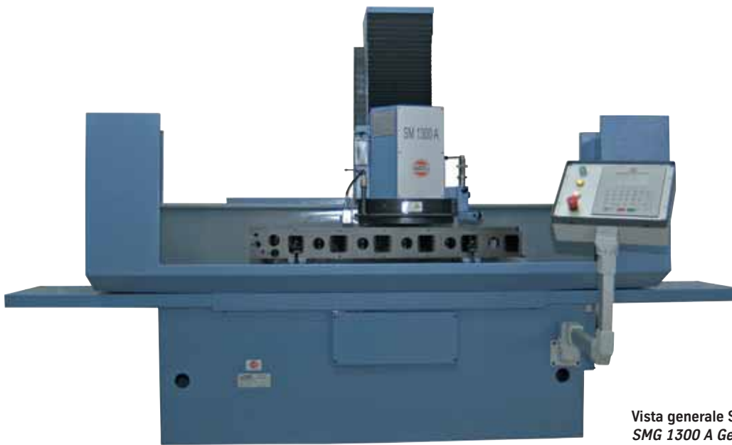
Vista generale SMG 1300 A con protezioni standard SMG 1300 A General view with standard guards

Grazie all'esperienza acquisita nel settore della ricondizionatura delle superfici di contatto delle testate e dei blocchi cilindri, Berco propone un nuovo ed innovativo prodotto, al fine di soddisfare le sempre maggiori esigenze degli utilizzatori. In questo specifico settore, la tendenza che si è affermata negli ultimi anni, è quella di abbandonare progressivamente la spianatura con settori abrasivi in favore della fresatura ad alte velocità di taglio, ottenibile con l'utilizzo di speciali inserti rotondi CBN e PCD senza l'impiego di liquido refrigerante. Questo sistema consente una notevole riduzione dei tempi di lavorazione, garantendo allo stesso tempo un elevato grado di finitura delle superfici con rugosità paragonabili a quelle ottenute tramite operazioni di rettifica. Nella progettazione e realizzazione di questo nuovo prodotto, Berco ha posto grande attenzione alla qualità dei materiali e dei componenti utilizzati, fra cui spiccano in particolare la struttura in fusione di ghisa estremamente robusta, le viti a ricircolazione di sfere ad alta precisione per la movimentazione della tavola e della testa, che, unite ai relativi azionamenti realizzati con motori a corrente continua, consentono